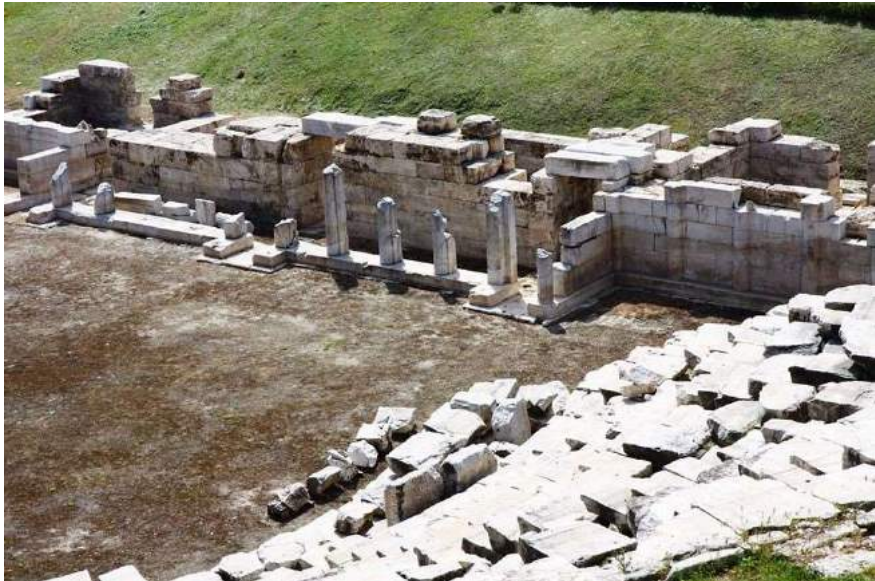
Εικ. 2 Η σκηνή του αρχαίου θεάτρου της Λάρισας.