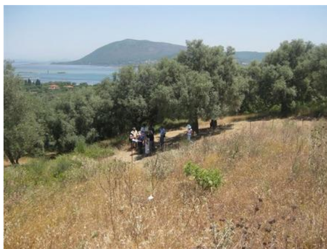
Άποψη του αμφιθεατρικού κατωφερούς κοιλώματος

Στη ΒΑ κλιτύ του μεσαίου λοφίσκου διαμορφώνεται αμφιθεατρικό κατωφερές κοίλωμα που απολήγει σε ένα επίμηκες επίπεδο τμήμα και ταυτίζεται με τη θέση του αρχαίου θεάτρου.