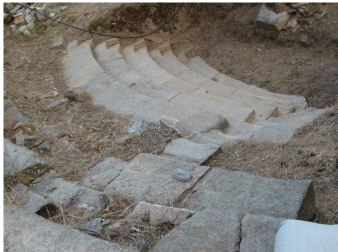
Το τμήμα της κερκίδας του θεάτρου και οι δύο κλίμακες που έχουν αποκαλυφθεί