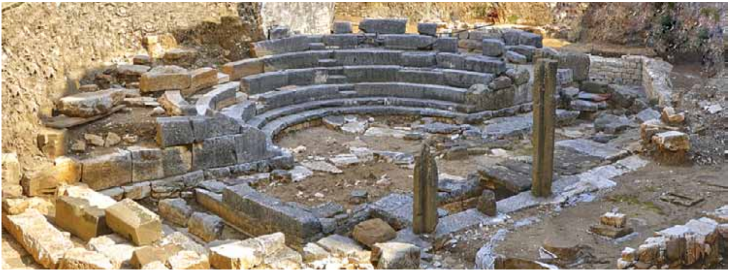
Αρχαίο θέατρο Αμβρακίας

εγχείρημα της διαμόρφωσης μιας τέτοιας διαδρομής στην Ήπειρο, σε μια μη ιδιαίτερα τουριστική περιφέρεια της Χώρας (παρά την ύπαρξη σημαντικών τουριστικών πυρήνων στα παράλια) δεν είναι εύκολο, διότι δεν υπάρχει «έτοιμη» τουριστική πελατεία-μαγιά στα μεγέθη , όπως υπάρχει σε άλλες περιοχές π.χ. Αττική, Κρήτη κ.λ.π. Αυτό, όμως, καθιστά το εγχείρημα πιο σημαντικό και πρωτότυπο για την περιοχή. Η αναμενόμενη τα πρώτα χρόνια τουριστική πελατεία, προς την οποία και θα στραφεί το στοχευμένο μάρκετινγκ της διαδρομής, είναι εσωτερική κυρίως, αλλά και, σε μικρότερα μεγέθη, εισερχόμενη: άτομα με υψηλό μορφωτικό επίπεδο και πολιτιστικά ενδιαφέροντα, είτε από το γενικό κοινό, είτε ανάμεσα στους ειδικούς επιστήμονες πχ ιστορικούς, αρχαιολόγους, αρχιτέκτονες, αλλά και θεατρολόγους, σκηνοθέτες, ηθοποιούς κ.λ.π.