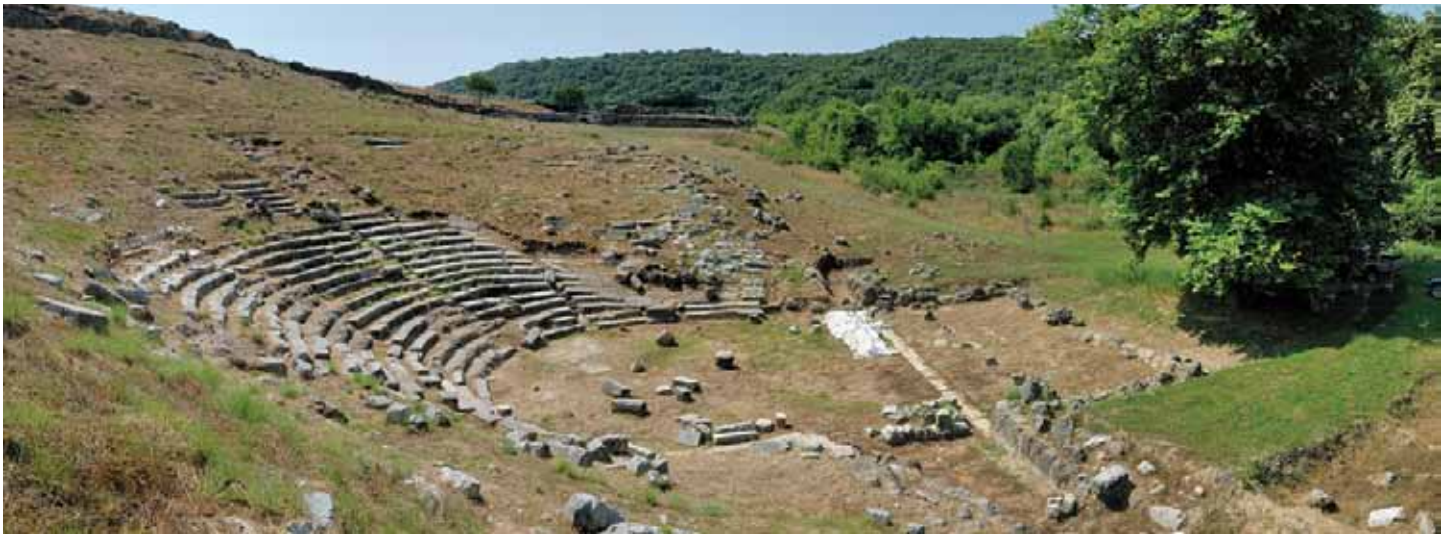
Αρχαίο θέατρο Γαίων

Ως εξειδικευμένο τουριστικό προϊόν η πολιτιστική διαδρομή προϋποθέτει οργάνωση και τοποθέτηση στην αγορά , κάτι που φυσικά δεν μπορεί να κάνει το κεντρικό κράτος, αλλά ούτε και ο ΕΟΤ στη σημερινή του τουλάχιστον μορφή. Πριν από αυτά προϋποθέτει επιλογή του συνεκτικού στοιχείου, των χώρων επίσκεψης, τεκμηρίωση, η οποία θα διευκολύνει όχι μόνο τις ξεναγήσεις, αλλά και τη δημιουργία έντυπου και ηλεκτρονικού πληροφοριακού υλικού. Επίσης, απαιτείται οργάνωση των επισκέψεων μέσα στους αρχαιολογικούς χώρους, παράλληλα με μικρές επεμβάσεις γύρω από αυτούς.