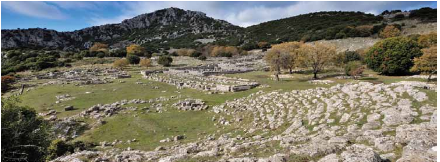
Αρχαιολογικός χώρος Κασσώπης

(archeology T.Os, classical tours T.Os κλπ),