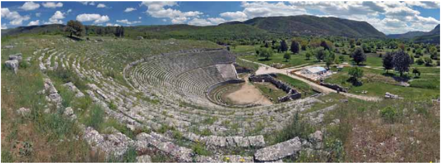
Αρχαίο θέατρο Δωδώνης