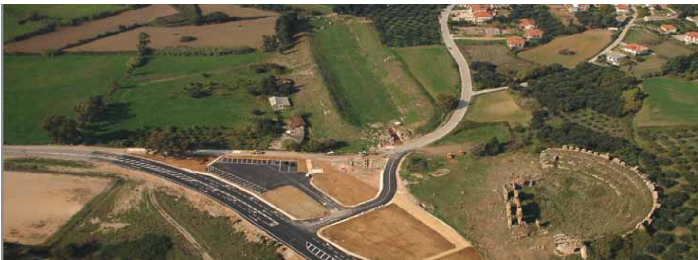
Αρχαιολογικός χώρος Νικόπολις

Μια πολιτιστική διαδρομή είναι ένα εξειδικευμένο και επώνυμο τουριστικό προϊόν, ένα προϊόν πολιτιστικού τουρισμού, το οποίο διαμορφώνεται με βάση ένα συγκεκριμένο συνεκτικό στοιχείο.