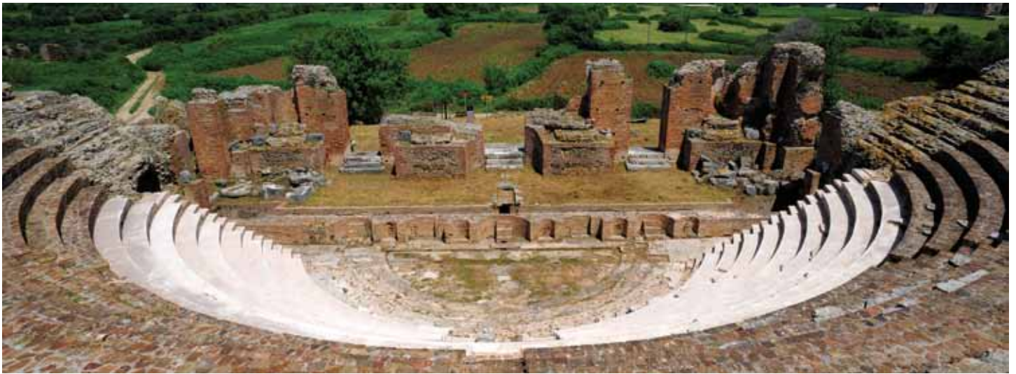
Ρωμαϊκό ωδείο Νικόπολης

ακουστικό υλικό για 5 έντυπα -φυλλάδια (ένα ανά αρχαιολογικό χώρο και ένα συνολικό για τη Διαδρομή), δύο αφισέτες, και ο κόμβος της διαδρομής. Προβλέπεται, επίσης, η καταγραφή των πρώτων μικρών επεμβάσεων που απαιτούνται για τη βελτίωση της προσπέλασης στους χώρους, καθώς και τη βελτίωση της πολιτιστικής εμπειρίας, στις οποίες περιλαμβάνονται οι αναγκαίες ενημερωτικές πινακίδες, μικρές επεμβάσεις προσπέλασης κ.λ.π. Περιλαμβάνονται, ακόμη, το σκεπτικό και οι όροι επιλογής διαφημιστικού γραφείου που θα καταρτίσει τον λογότυπο και το δημιουργικό του έντυπου και ηλεκτρονικού υλικού της Διαδρομής.