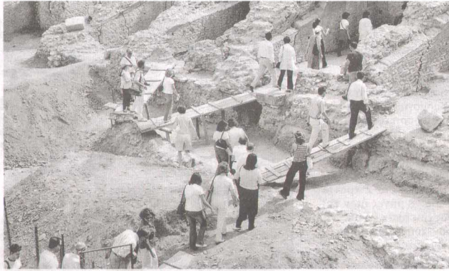
Πάνε δέκα χρόνια από τότε που οι αρχαιολόγοι μάς ξεναγούσαν στο θέατρο της αρχαίας Ρώμης. Εκτοτε υπήρξε πρόοδος, αλλά η πόλη δεν έχει αγκαλιάσει το θέμα

Η διαδρομή μου στον δημόσιο χώρο που με διδάξε ότι τα όρια του κράτους είναι πεπερασμένα και την απεραιτοσύνη τη συναντάει κανείς μόνον στις ψυχές των ανθρώπων και στον εθελοντισμό. Αυτό το μάθημα το πήρα κυρίως όταν διαχειριστικά το πιο οδυνηρό, αλλά συνάμα και το πιο σημαντικό κεφάλαιο της πολιτικής μου πορείας που ήταν οι σεισμοί της γενέθλιας πόλης μου της Καλαμάτας. Κι εκεί αναδείχτηκε το θάμα, που είναι και ο