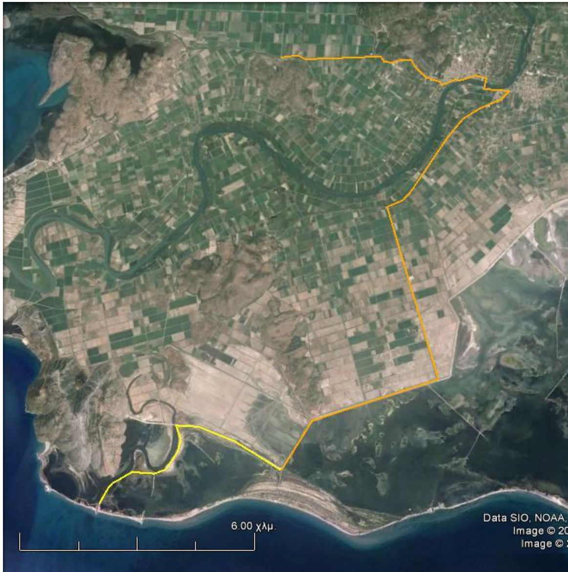
Χάρτης 3: ΔΙΑΔΡΟΜΗ ΟΙΝΙΑΔΕΣ – ΠΑΛΙΟΠΟΤΑΜΟΣ Πορτοκαλί γραμμή : Ασφαλτος / Κίτρινη Γραμμή: Χωματόδρομος για ασφαλτόστρωση