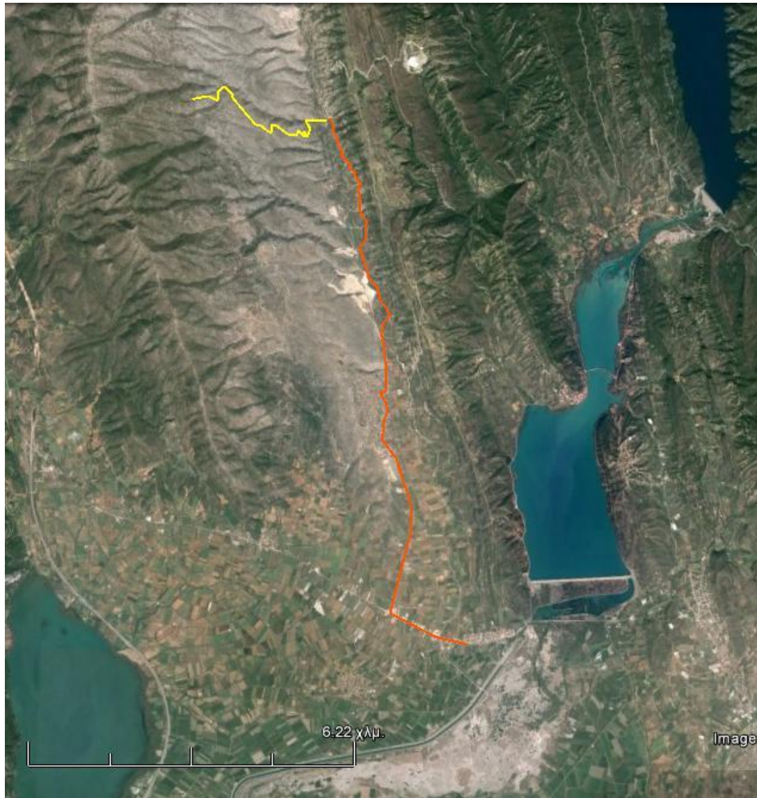
Χάρτης 4: ΔΙΑΔΡΟΜΗ ΣΤΡΑΤΟΣ – ΑΓΡΙΑ ΑΛΟΓΑ ΠΕΤΑΛΑ Πορτοκαλί γραμμή : Ασφαλτος / Κίτρινη Γραμμή : χωματόδρομος προς βελτίωση