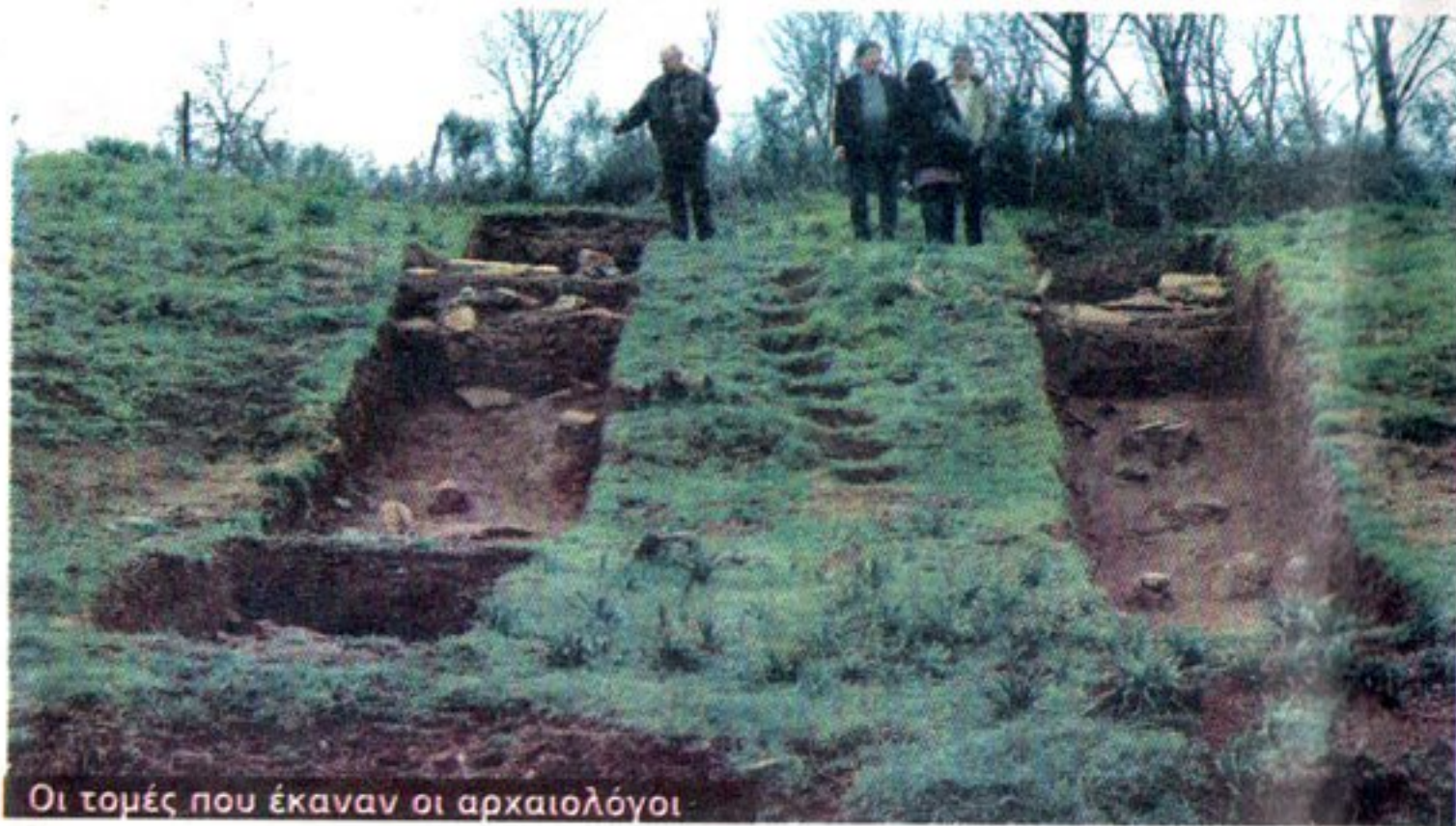
Οι τομές που έκαναν οι αρχαιολόγοι